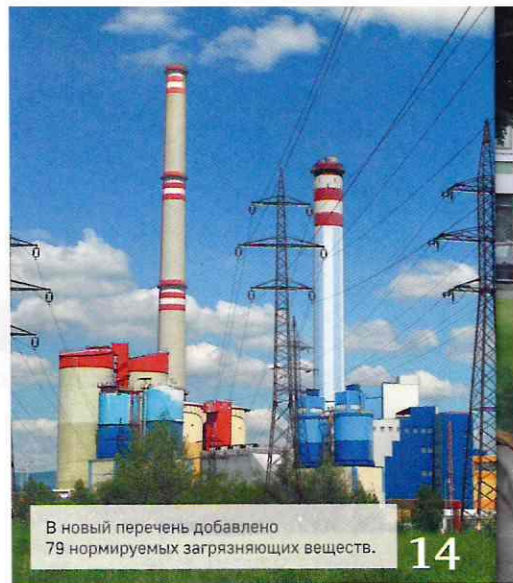
В новый перечень добавлено 79 нормируемых загрязняющих веществ.

76 М. М. Пукемо Проблемы сброса сточных вод на рельеф и их возможные решения